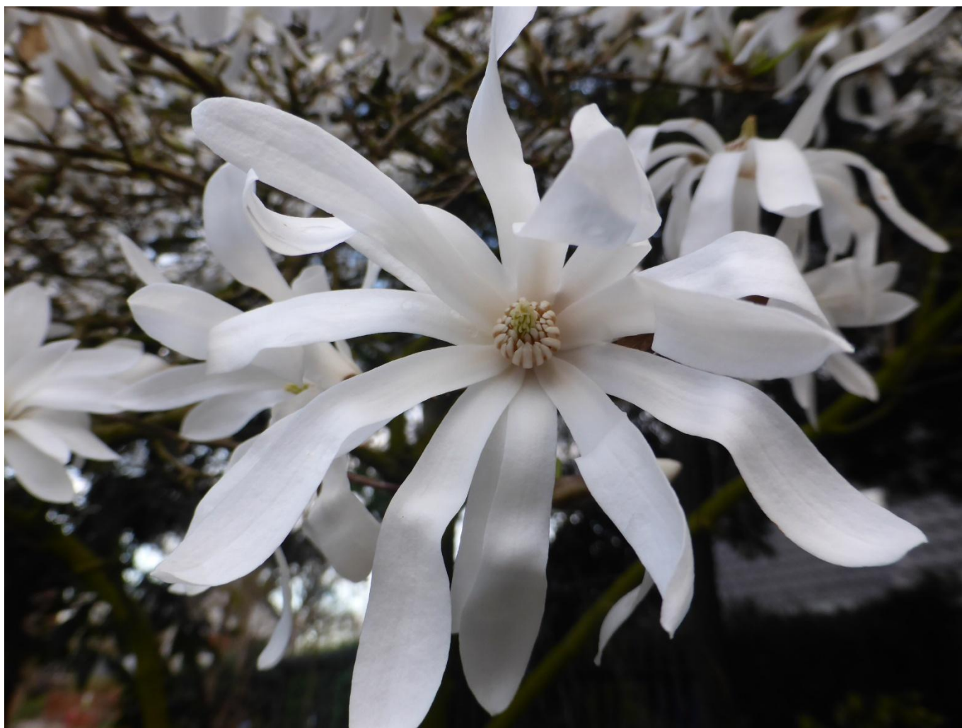
Stermagnolia eigen tuin