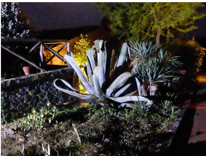
Reuze agave bij ons vakantieadres

Tot zover mijn overpeinzingen. Ik hoop jullie terug te zien bij een excursie of bij de eerstvolgende lezing in september.