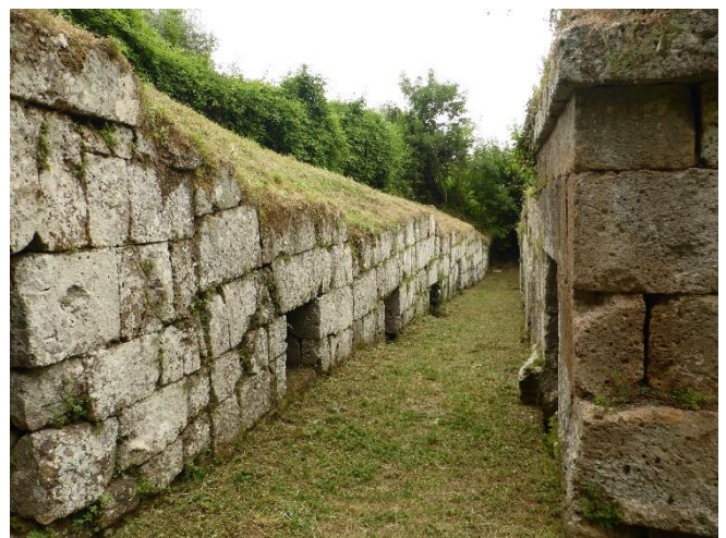
Etruskische opgravingen bij Orvieto